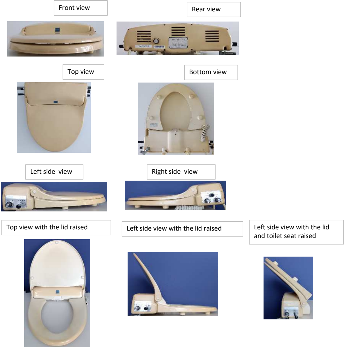
Photo of the actual product